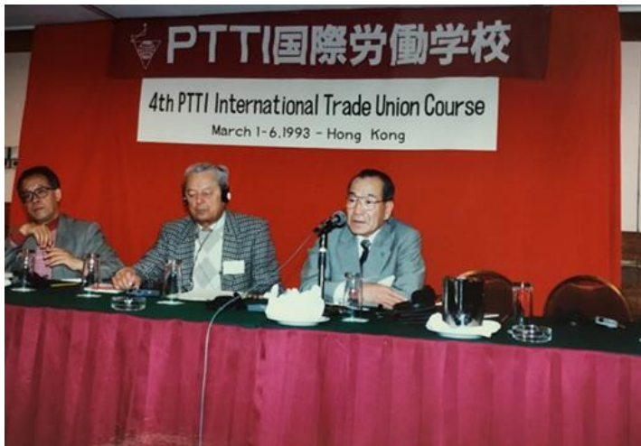
PTTI国際労働学校での講演(1993年)