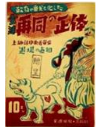
産別会議旧蔵パンフレット類