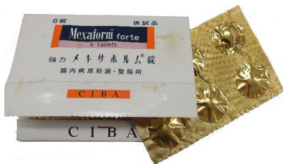
スモンの原因となったキノホルム剤