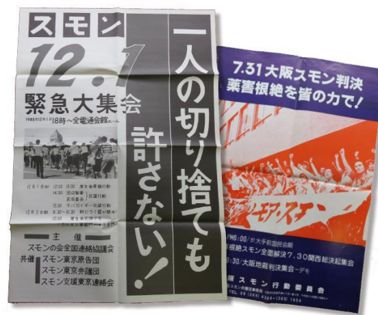
79年大阪地裁判決時および83年患者救済 大集会時のポスター