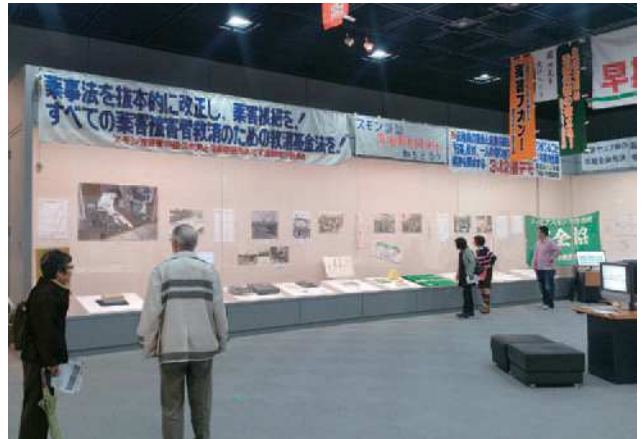
大阪人権博物館における企画展の様子