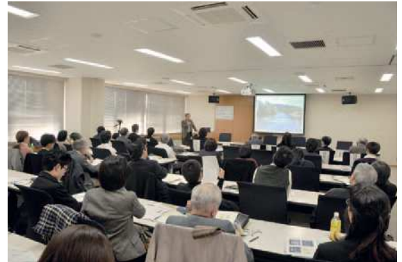
環境アーカイブズ資料公開室オープン記念シンポジウム