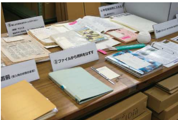
ミニコミ資料劣化防止作業

そして、このような活動計画の一環に、本ニュースレターの刊行がある。ウェブによる広報だけではなく、ニュースレターを作成し幅広く手に取っていただくことによって、より多くの方に環境アーカイブズの資料と活動を知ってもらうことが本誌刊行の目的である。今後、年1回のペースで刊行していく