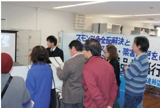
社会・労働関係資料センター連絡協議会見学の様子