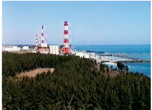
福島第一原発全景（1990年1月）