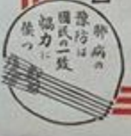
【タイトル】 結核早期診断所御案内 三重県結核予防協会