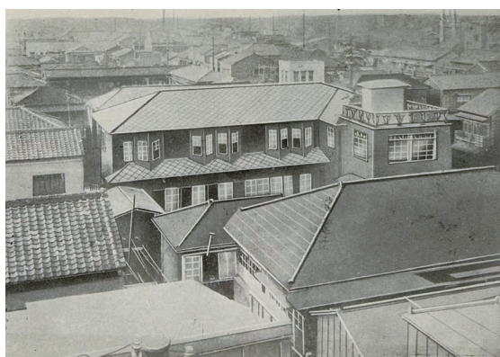
② セツルメント・ハウス全景 (『東京帝国大学セツルメント年報』7号， 東京帝国大学セツルメント，1931年6月)