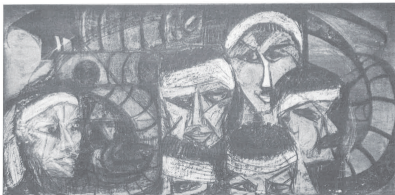
⑤ 新世紀群による 共同制作 (1955-56年頃)