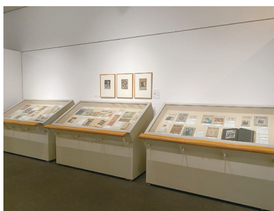
② 「彫刻刀が刻む戦後日本」展 サークル誌展示風景