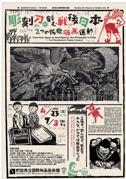
① 「彫刻刀が刻む戦後日本 2つの民衆版画運動」展 ちらし