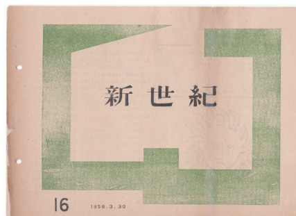
③ 『新世紀』16号 (編集・発行：美術サークル新世紀群)