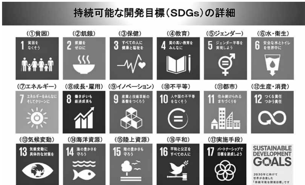
図1 持続可能な開発目標（SDGs）

そして、ポスト・ミレニアム開発目標ということで提起されたのがSDGsであり、サステナビリティがキーワードです。サステナビリティとは決して環境問題だけを意味するのではなく、バランスの取れた開発、人間が今後どのように地球のなかで共存して生きていくかという意味を持っています。SDGsでは図1のように、①貧困、②飢餓、③保健、④教育、⑤ジェンダー、⑥水・衛生、⑦エネルギー、⑧成長・雇用、⑨イノベーション、⑩不平等、⑪都市、⑫生産・消費、⑬気候変動、⑭海洋資源、⑮陸上資源、⑯平和、⑰実施手段という17の目標が挙げられています。ミレニアム開発目標でも挙がっていた教育やジェンダーといったテーマが目標に入っているだけでなく、環境や資源などの問題が新たに重視されるようになってきました。また雇用の問題も入っています。持