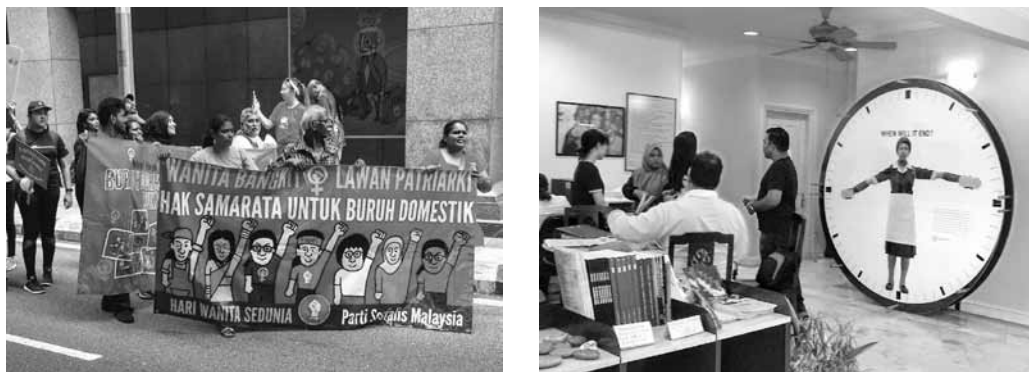
図2 アジアの外国人家政婦を支援する運動と支援NGOオフィス

業態もあります。海外に対する業務外部委託，BPO（Business Process Outsourcing）サービスと言われるものです。具体的には，コールセンター，データ入力，ソフトウェア開発，画像加工などの作業を海外から請け負うものです。特にフィリピンやインドは高い英語力を活かして，欧米向けのコールセンターやITのソフトウェア開発などを行っています。中国，タイ，ベトナム，ミャンマー，バングラデシュでは，データ入力やソフトウェア開発などを進めています。ITのソフトウェア開発などは男性が多いですが，コールセンターのオペレーターはほとんどが女性です。これは新たな労働形態で，出稼ぎでなく地元で働けるメリットはあるのですが，24時間シフト制の問題などの課題や問題点も出てきています。