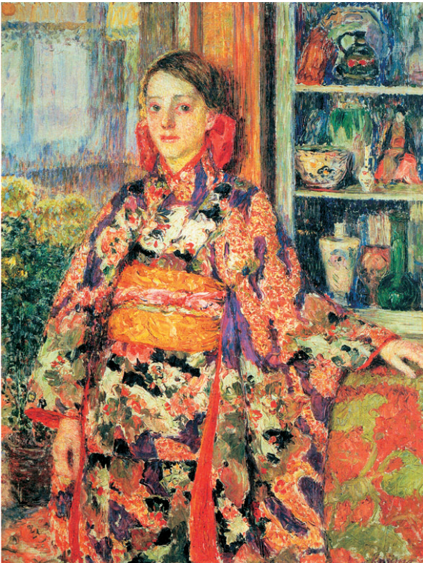
児島虎次郎 (1881~1929) 《和服を着たベルギーの少女》 1911年作 油彩・カンバス 116.0×89.0cm