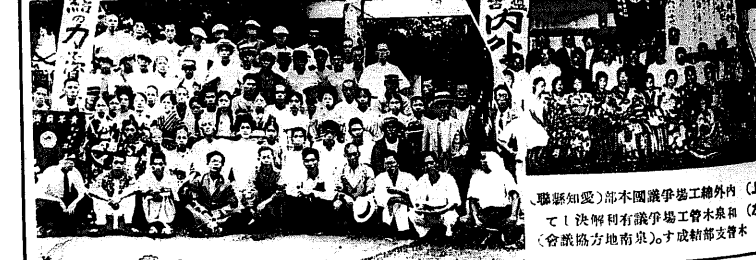
下、係給値下問題多有 利に解決したシン ガミシン神戸中 央店従業員諸君 (兵庫縣)